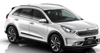
SWP (Snow White Pearl)