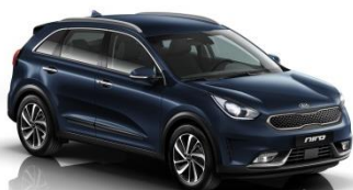
B4U (Gravity Blue)