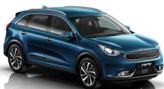
C3U (Deep Blue)