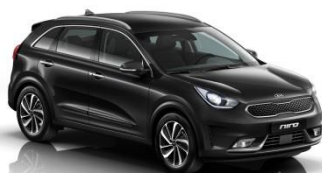
ABP (Aurora Black)