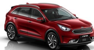
CR5 (Runway Red)