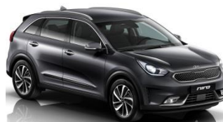
ABT (Platinum Graphite)