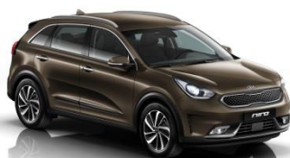
DN9 (Rich Espresso)