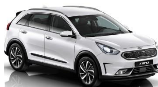
UD (Clear White)