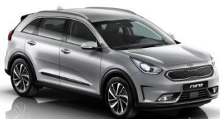
4SS (Silky Silver) bez dopłaty