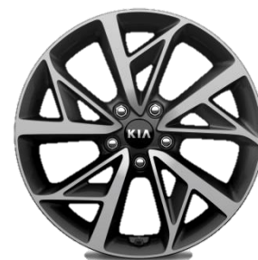
Felgi aluminiowe 18 calowe z oponami 225/45/R18