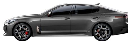
Panthera Metal (P2M)