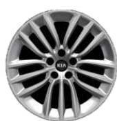
L, XL: 18" aluminiowe obręcze kół z oponami w rozmiarze 225/45R18