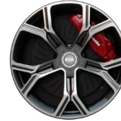
GT: 19" aluminiowe obręcze kół z oponami w rozmiarze przód: 225/40 R19 tył: 255/35 R19