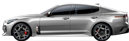
Ceramic Silver (C4S)