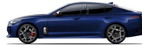
Deep Chroma Blue (D9B)