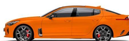
Neon Orange (N20) bez dopłaty