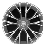
GT Line: 19" aluminiowe obręcze kół z oponami w rozmiarze przód: 225/40 R19 tył: 255/35 R19