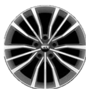
GT Line 2.2D: 18" aluminiowe obręcze kół z oponami w rozmiarze 225/45R18