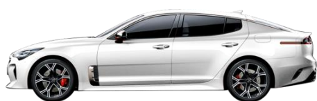
Pearl White (SWP)