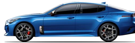
Micro Blue (M6B)