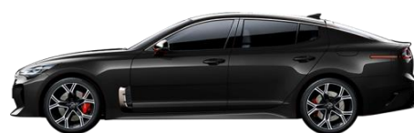
Aurora Black (ABP)