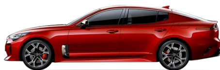
High Chroma Red (H4R)