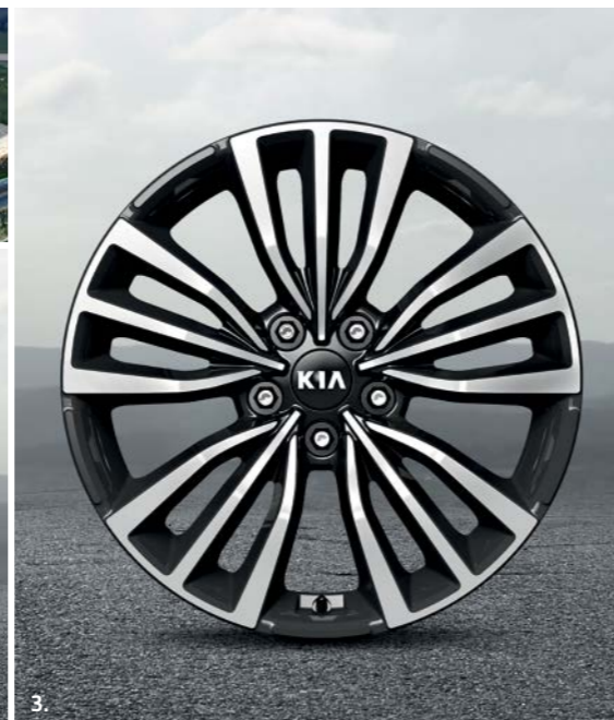
3. Obręcz koła 18" ze stopu lekkiego, typ B Dwukolorowa obręcz 18" ze stopu lekkiego, o pięciu potrójnych ramionach, 8.0Jx18, do opon 225/45 R18. J5F40AK110