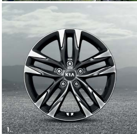
1. Obręcz koła 17" ze stopu lekkiego, typ A Dwukolorowa obręcz 17" ze stopu lekkiego, o pięciu podwójnych ramionach, 7.0Jx17, do opon 225/50 R17. J5F40AK000