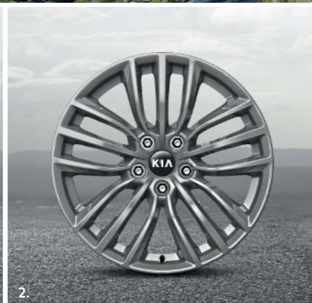
2. Obręcz koła 18" ze stopu lekkiego, typ A Obręcz 18" ze stopu lekkiego, o pięciu potrójnych ramionach, 8.0Jx18, do opon 225/45 R18. J5F40AK100