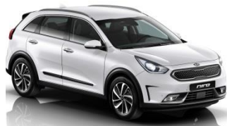
UD (Clear White)