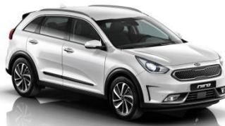
SWP (Snow White Pearl)