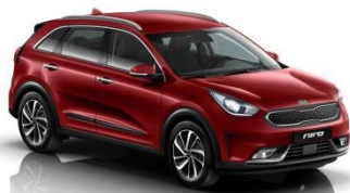
CR5 (Runway Red)