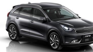
ABT (Platinum Graphite)