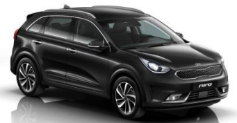
ABP (Aurora Black)