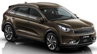
DN9 (Rich Espresso)