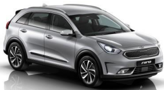
4SS (Silky Silver) bez dopłaty