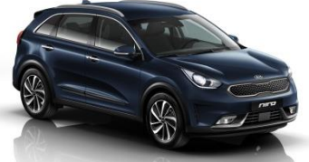
B4U (Gravity Blue)