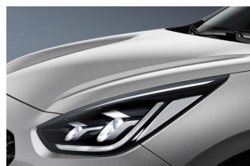
4SS (Silky Silver) bez dopłaty