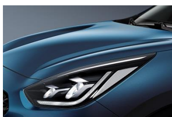
C3U (Deep Blue)