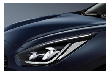
B4U (Gravity Blue)