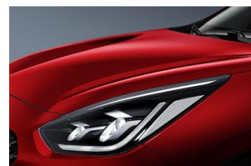
CR5 (Runway Red)