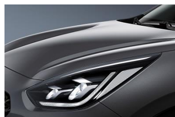
ABT (Platinum Graphite)