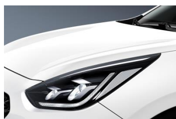
UD (Clear White)