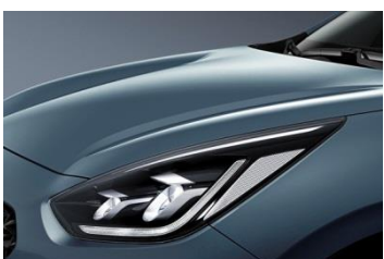
BBL (Horizon Blue)