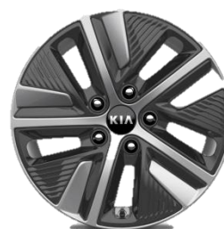
Felgi aluminiowe 16 calowe z oponami 205/60/R16