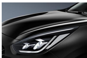
ABP (Aurora Black)