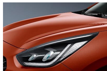
DRG (Orange Delight)