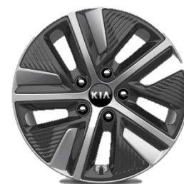
Felgi aluminiowe 16 calowe z oponami 205/60/R16