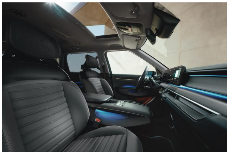
Wersja Earth wnętrze RBQ, opcja CP1