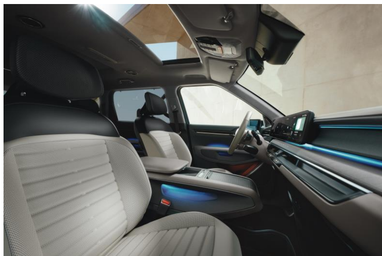
Wersja Earth wnętrze EMA, opcja CP1