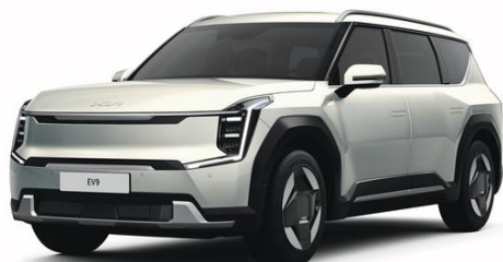
Ivory Silver (ISG) metalizowany, niedostępny dla GT-Line