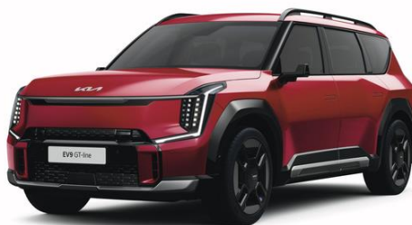
Flare Red (C7R) metalizowany, niedostępny z tapicerką NJR, lakier bez dopłaty