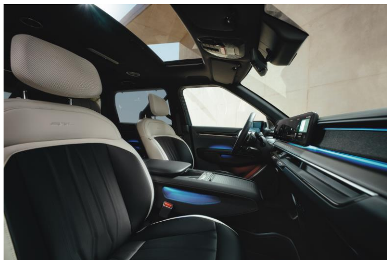
Wersja GT-Line wnętrze RBQ