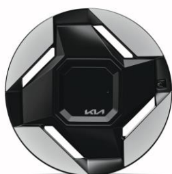
19" felgi aluminiowe (Earth)