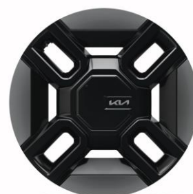
21" felgi aluminiowe (GT-Line)