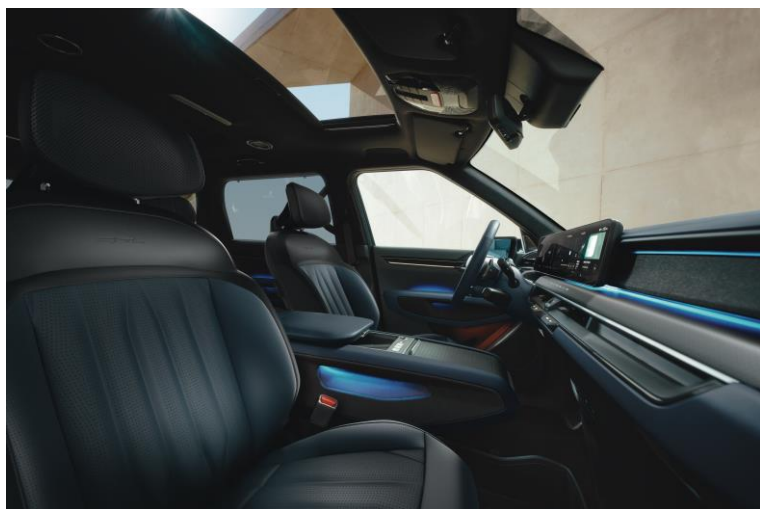
Wersja GT-Line wnętrze NJR