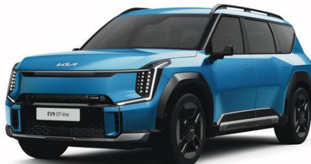
Ocean Blue (OBG) metalizowany, niedostępny dla Earth